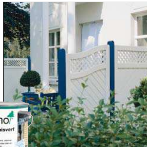
Tuinafscheiding behandeld met Osmo Landhuisverf 2101 wit en 2506 koningsblauw

Tuinhuis behandeld met Osmo Landhuisverf 2308 noors rood en 2101 wit